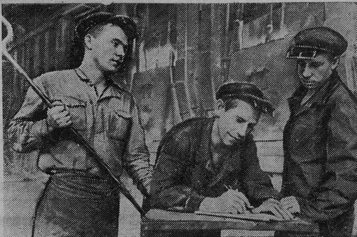
Москва. Сбор подписей под Обращением Всемирного Совета Мира о заключении Пакта Мира между пятью великими державами.

Народы мир в боях завоевали, Его нарушить не позволим никому Мы твердо и уверенно сказали: — Стремленье к миру победит войну!