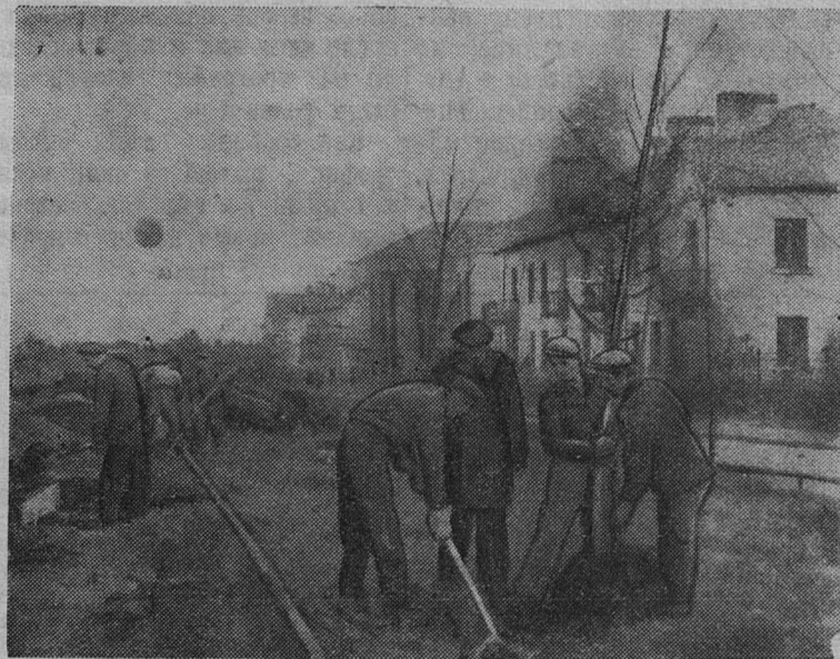
С каждым годом все краше и благоустроеннее становятся Сланцы.

На снимке: посадка молодых деревьев на улице Ленина.