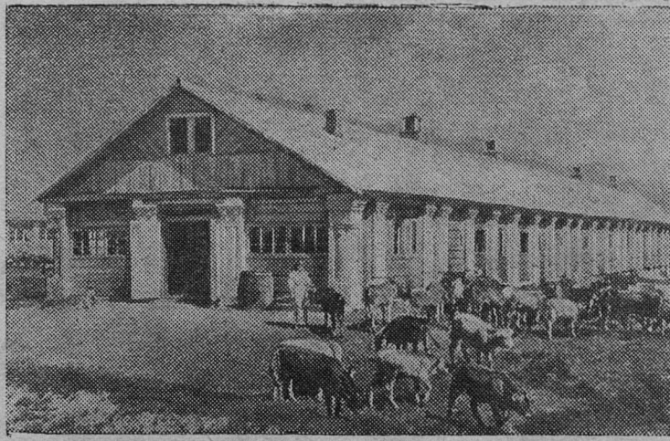
Брянская область. Совхоз «Коммунар» во время Великой Отечественной войны был разрушен немецко-фашистскими оккупантами. Сейчас он восстановлен. Построены новые скотные дворы, телятник, электростанция, водонапорная башня.