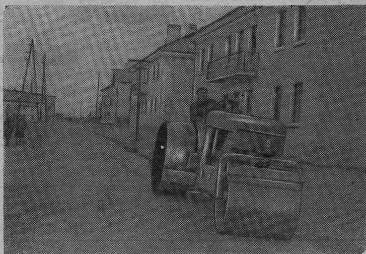
Сланцы. Работы по благоустройству Спортивной улицы.