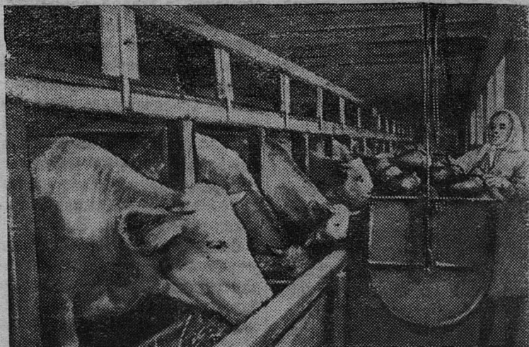
Винницкая область. Колхоз „Третий решающий“ Крыжопольского района выполнил трехлетний план развития общественного животноводства. Досрочно завершена годовая план сдачи молока и мяса.