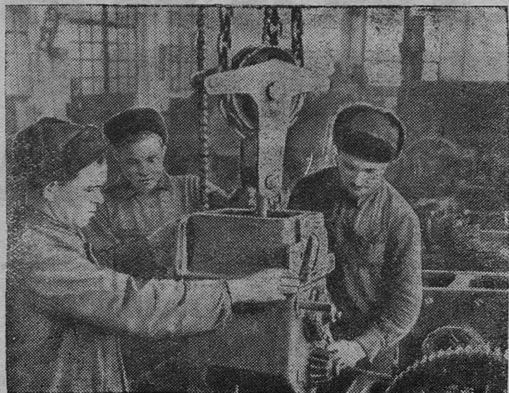
Новосибирская область. Механизаторы Барышевской МТС приступили к ремонту тракторов и сельскохозяйственных машин. Ремонт производится узловым методом.

У нас имеются все возможности, чтобы в новом сельскохозяйственном году добиться лучших показателей в своей работе. Колхозы и Рудненская МТС располагают достаточным количеством материально-технических средств. В коллективном труде выросли замечательные люди, обладающие опытом умелого ведения хозяйства. Нет сомнения в том, что колхозники, механизаторы, специалисты сельского хозяйства будут и дальше трудиться с полной энергией, отдавать свои силы решению главной задачи — значительному повышению урожайности всех сельскохозяйственных культур, увеличению общественного поголовья скота при одновременном росте его продуктивности.