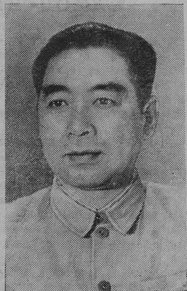
Чжоу Эн-лай премьер Государственного административного Совета и министр иностранных дел Китайской Народной Республики.