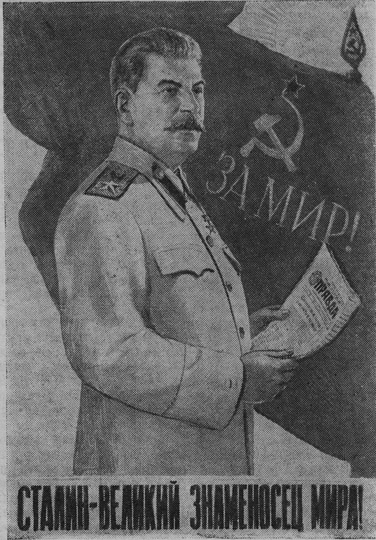
СТАЛИН — ВЕЛИКИЙ ЗНАМЕНОСЕЦ МИРА!

Первое военное нападение международного капитала на страну Советов окончилось полным крахом. Но это не устранило опасности новых нападений империалистов на Советскую республику. Вистори-