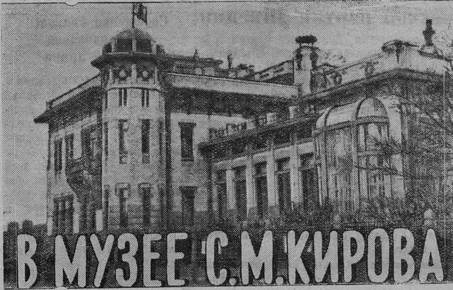
В МУЗЕЕ С.М.КИРОВА

65 лет назад, 27 марта 1886 г. в глухом приуральском городке Уржуме родился человек, светлое имя которого стало известным всему миру, как имя пламенного большевика-трибуна революции. Верный сын партии Ленина—Сталина, С. М. Киров отдал всю свою жизнь беззаветному служению народу.