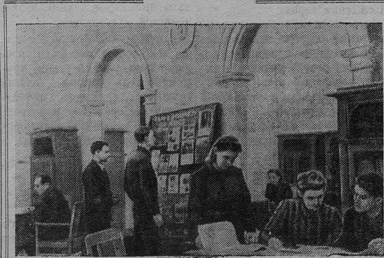
Для металлургов Сталинградского завода «Красный Октябрь» недавно построено новое здание Дома техники. Здесь имеются зрительный и лекционный залы, комнаты для занятий кружков, библиотека и читальный зал.

На снимке: в читальном зале Дома техники.