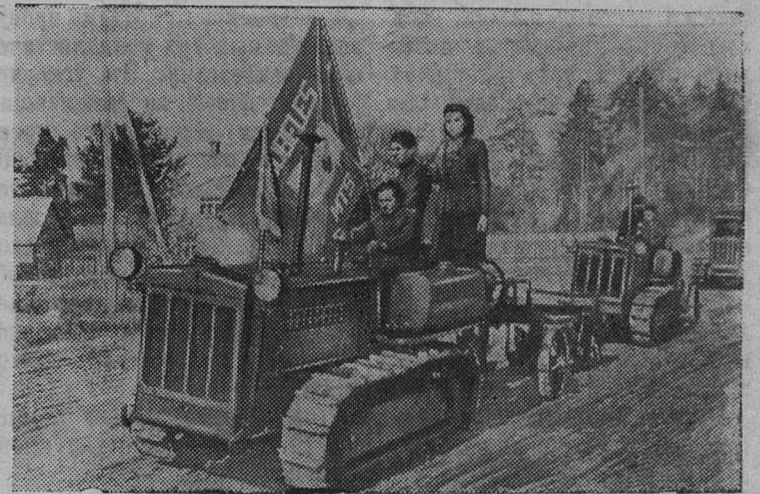
Латвийская ССР. Тракторная колонна 8-й бригады Добельской МТС выезжает на весенние посевные работы.