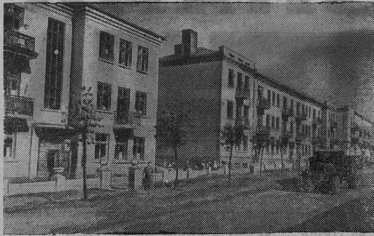
Украинская ССР. Одна из улиц в поселке Днепропетровского завода металлоконструкций имени Молотова.