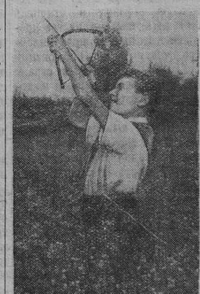
На снимке: На зеленой лужайке в Сланцах.

Лето. Юные авиамodelисты на зеленых лужайках пускают модели, любители меткости целятся из лука, городошники играют в городки, девочки собирают цветы и гербарии.