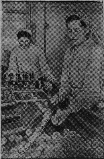
В цехах Глебовской птицефабрики Московской области для быстрой сортировки яиц применяется автоматическая машина. На снимке: механизированная сортировка яиц.