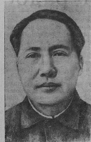
Мао Цзе-дун — Председатель Центрального Народного Правительства Китайской Народной Республики

В ближайшие дни в кабинете намечено прочитать доклады: «Как работают технические кабинеты при советских предприятиях», «Роль мастера на советском заводе» и др.