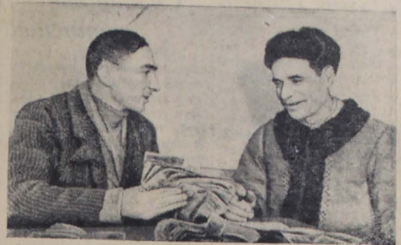
Станиславская область. Хороший урожай вырастил в этом году колхоз-миллионер имени 1-го Мая Сиватинского района. На каждый трудящийся колхозники получили по 6 килограммов зерна и по 7 рублей деньгами.