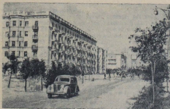
По городам Советского Союза Сталинград. Новые жилые дома по Ново-Вокзальной улице.