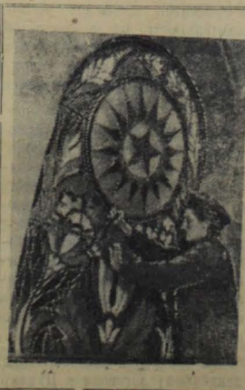
ДОМА, ПОСТРОЕННЫЕ В МОСКВЕ В 1952 ГОДУ

Строители Москвы, успешно завершив план 1951 года, широко развернули соревнование за досрочное выполнение программы жилищного и культурно-бытового строительства 1952 года, за повышение качества работ, экономию материалов.