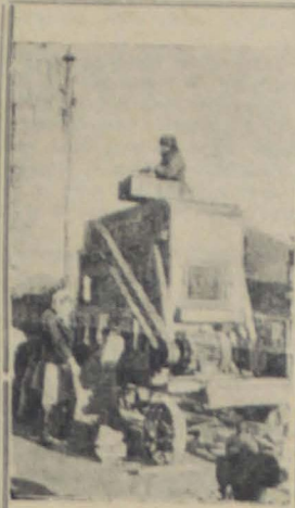
Полтавская область. В колхозе „Культура“, Полтавского района заканчивается очистка посевного материала к весеннему севу. На снимке: машинная очистка семян.