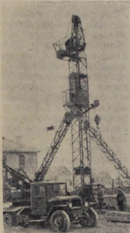
Украинская ССР. На строительстве Каховской гидроэлектростанции непрерывно поступает новая отечественная техника. Недавно прибыло еще 9 башенных кранов.

★ Пилкаторные станции Латвии в этом году поставят сельхозартелям около двух миллионов пиллат. (ТАСС)