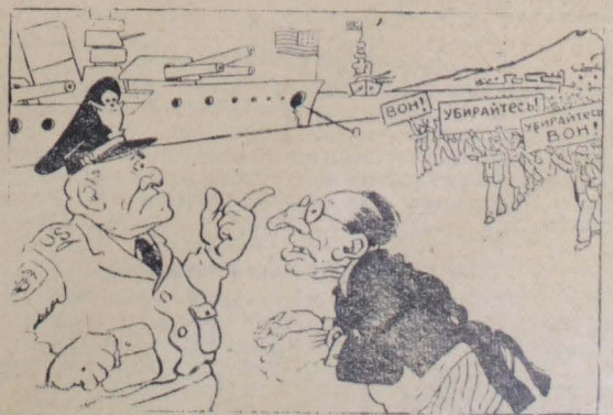
Американский генерал:—Господин де Гаспери, чего этим итальянцам у нас в Ливорно надо?

Детоубийцы, гангстеры, шпраты. — Звериное отродье Ку-Клукс-Клана. Скажите нам: зачем пришли вы в хаты, Зачем бомбили улицы Пхеньяна? Зачем огнем напалмовым сжигали Грудных младенцев, женщин одряхлевших? Зачем живьем в могилы зарывали Бойцов Кореи — патриотов смелых? В очаг огня, в пустыню и руины Вы города и села превратили. А бывшие цветущие долины Чумой, холерой, тифом заразили. Не выйдет! Нет! Фашисты, изуверы. Не запугать вам, гады, силы мира Ни атомом, ни палочкой холеры, Ни бомбами ньюйоркского вампира. Придет пора (она почти что рядом, К ней устремлен простых народов взор), Тогда за все разбойникам-пиратам Народ прочтет свой грозный приговор.