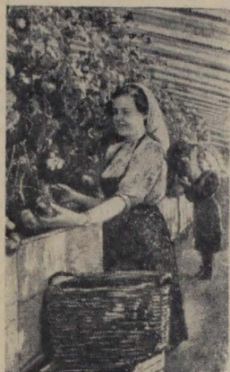
Коми АССР. При комбинате «Воркутауголь» имеется большое тепличное хозяйство, которое снабжает шахтеров свежими овощами.