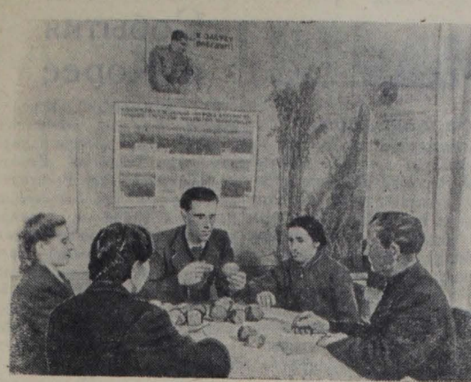
Московская область. В совхозе «Изберекские поля орошения» на агротехнических курсах занимаются более 50 человек. На снимке: на занятиях агротехнических курсов.