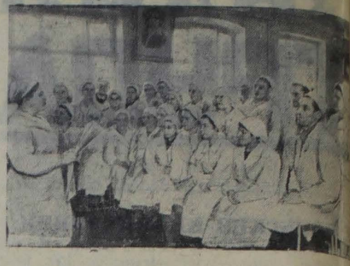
Москва. В духах кондитерской фабрики «Красный Октябрь» агитаторы проводят беседы.

секретарь партбюро управления треста «Ленинградсланец».