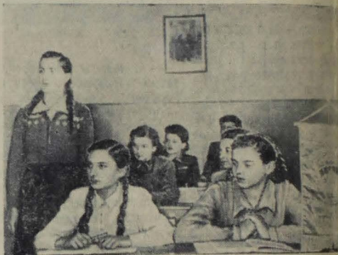
В Венгерской Народной Республике растет сеть учебных заведений. Число учащихся средней школы за год возросло почти на 108 тысяч человек. Большое внимание уделяется распространению знаний среди национальных меньшинств, живущих в Венгрии. Созданы гимназии, в которых преподавание ведется на языках национальных меньшинств. На снимке: в одном из классов сербско-хорватской гимназии в Будапеште.