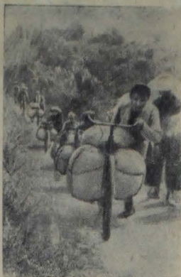
Демократическая республика Вьетнам. На снимке: крестьяне доставляют продовольствие Народной армии.

шахматисты, набравшие по 6,5 очка из 7 возможных. На третьем месте представитель финских студентов, набравший 3,5 очка.