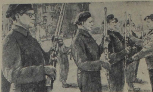
В Западной Германии оккупационные власти содействуют возрождению милитаризма. Под видом полиции восстанавливается армия. Систематически проводится боевая подготовка солдат. На снимке: немецкие наемные солдаты при оккупационных войсках западных держав в Западной Германии.