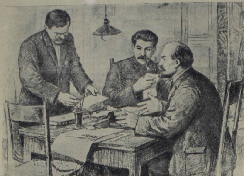
В. И. Ленин, И. В. Сталин и В. М. Молотов в редакции Центрального Органа РСДРП(б) — «Правда» в 1917 г.

Печать должна расти не по дням, а по часам,—это самое острое и самое сильное оружие нашей партии. И. В. СТАЛИН.