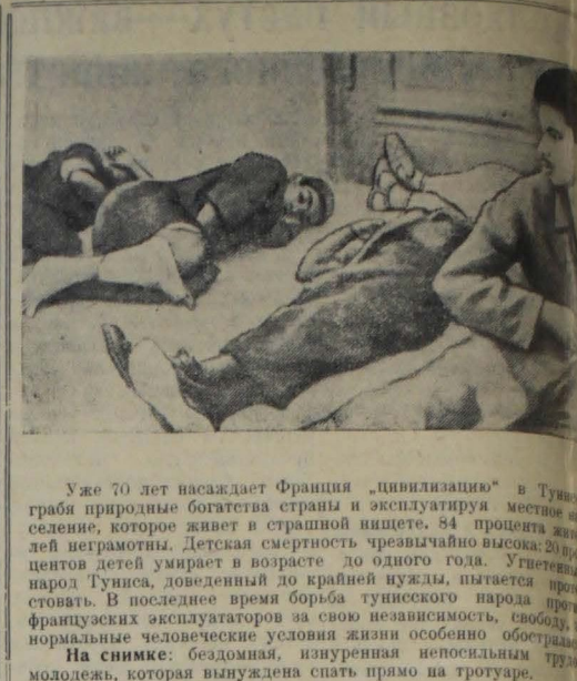
Уже 70 лет насаждают Франция «цивилизацию» в Тунисе, грабят природные богатства страны и эксплуатируют местное население, которое живет в страшной нищете. 84 процента жителей неграмотны. Детская смертность чрезвычайно высока: 20 процентов детей умирает в возрасте до одного года. Угнетенный народ Туниса, доведенный до крайней нужды, пытается protestовать. В последнее время борьба тунисского народа против французских эксплуататоров за свою независимость, свободу, за нормальные человеческие условия жизни особенно обострилась. На снимке: бездомная, изурнувшая непосильным трудом молодежь, которая вынуждена спать прямо на тротуаре.

Первомайские митинги и демонстрации состоялись в Осака, Кобе, Киото, Кавасаки, Фукуока и многих других городах Японии. По предварительным данным, всего в стране было проведено около 500 митингов и демонстраций, в которых участвовало свыше 2 млн. человек.