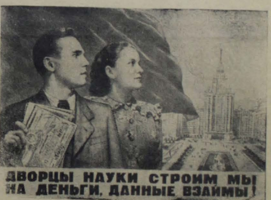
ДВОРЦЫ НАУКИ СТРОИМ МЫ НА ДЕНЬГИ, ДАННЫЕ ЗАЙМАМ!

Один за другим выступают шоферы, слесари-ремонтники, инженерно-технические работники. Их всех объединяет одна дума — дума о мире, о новом подъеме и процветании Советского государства.