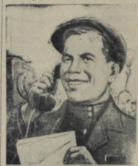
МЫ ВСЕ, КАК ОДИН ПОДПИСАЛИСЬ НА ЗАЕМ

За два часа все колхозники дружно окончили подписку.