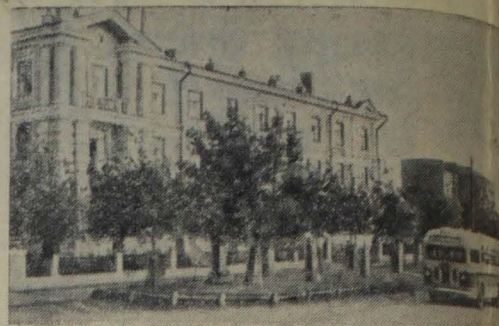
Молотовская область. Улица Челюскинцев в гор. Березники. Пресеклище ТАСО. Фото С. Шумкова.

ОТ РЕДАКЦИИ. Учитывая важность вопроса, поднятого т. Малининой в своей статье «Повысить роль производственных совещаний», редакция газеты «Знамя труда» просит профсоюзных работников и руководителей предприятий, шахт и строек г. Станция выступить на страницах нашей газеты, поделиться опытом, как организуются и проводятся производственные совещания и почему они оказывают помощь в выполнении плана.