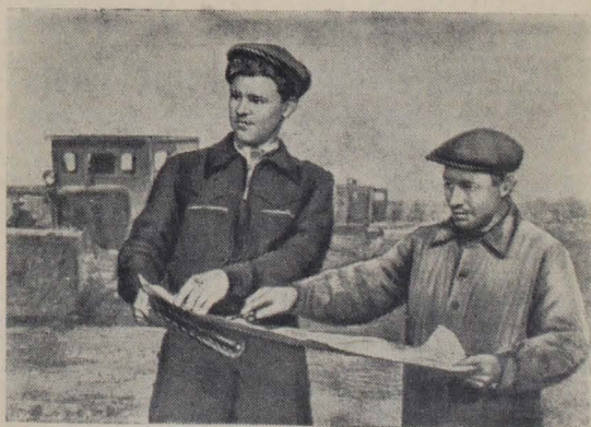
Украинская ССР. На строительстве Каховской ГЭС в пойме Днепра началось обвалование берега судоходного шлюза. Работы выполняются мощными бульдозерами.