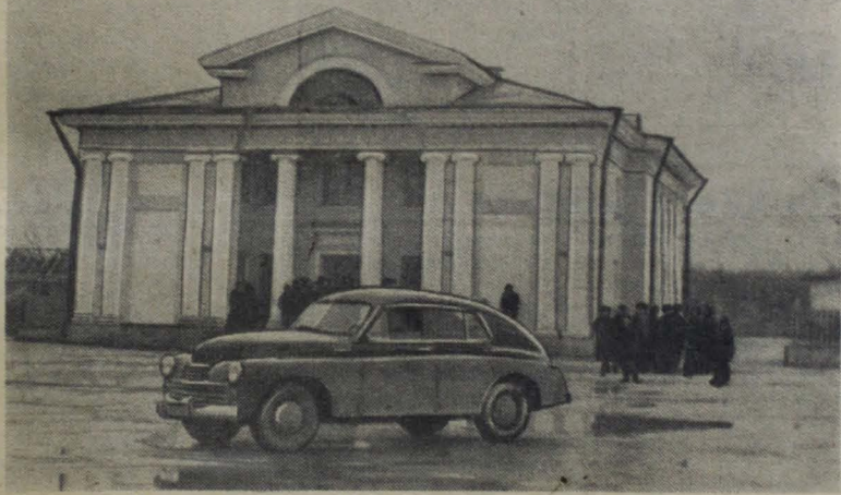
На снимке: клуб «Шахтер» в поселке Большие Лучки.