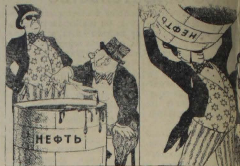
— Принеся мне ложку! Рис. И. Семенова.