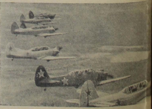
На снимке: самолеты спортивной авиации в полете.