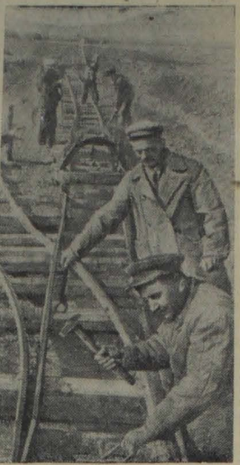
Краснодарский край. В колхозе «Память Ильича» Марьяновского района строят механизированный кирпично-черепичный завод. На снимке: сооружение узкоколейной дороги к заводу.