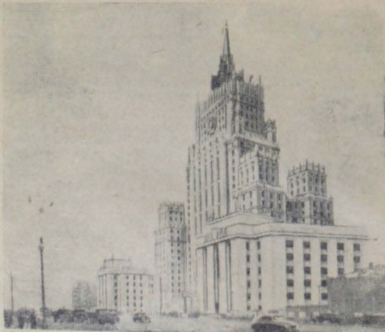
Москва. Высотное административное здание на Смоленской площади.

А. Михайлов, депутат Попковогорского сельсовета.