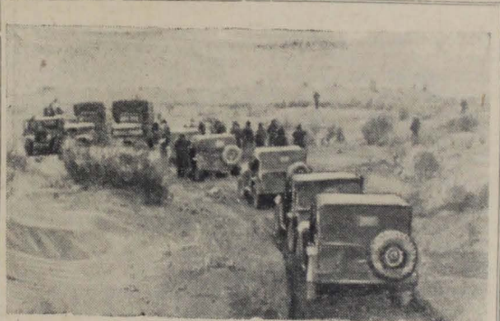
Туркменская ССР. Постоянная комплексная бригада ученых по оказанию научной помощи строительству Главного Туркменского канала при Академии наук СССР побывала на северном участке трассы канала, прошла по Уабою до колодца Гарышлы и обратно в восточном направлении до Куни-Ургенча. Участники экспедиции преодолели около тысячи километров. На снимке: экспедиция у развалин крепости Ярбекир-Кала.

В строй вступил ряд новых здравниц. В СССР насчитывается сейчас 350 курортов с 2.130 санаториями. За прошлый год в них отдохнуло и получило лечебную помощь свыше четырех миллионов человек. В нынешнем году число обслуженных здравницами возрастет еще больше.