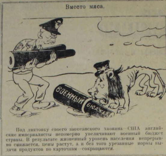
Под диктовку своего заокеанского хозяина — США английские империалисты непомерно увеличивают военный бюджет страны. В результате жизненный уровень населения непрерывно снижается, цены растут, а и без того урезанные нормы выдачи продуктов по карточкам — сокращаются.

Недавно весь мир узнал о неслыханных пытках и изгнаниях военнопленных в американских