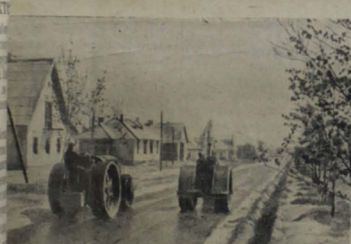
Волгодонстрой. Благоустриваются и озеленяются поселения эксплуатационников Волго-Донского судоходного канала. На снимке: асфальтирование улицы Ленина в поселке евка.