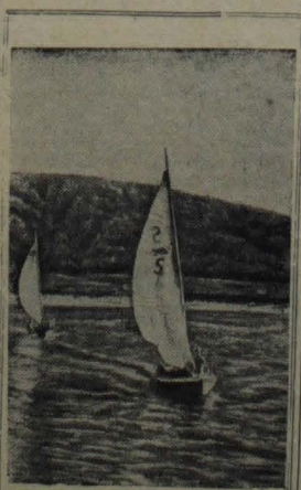
Кубышевский гидрострой. На снимке: яхта имени строителя Кубышевского ГЭС на тренировочной прогулке по Волге.