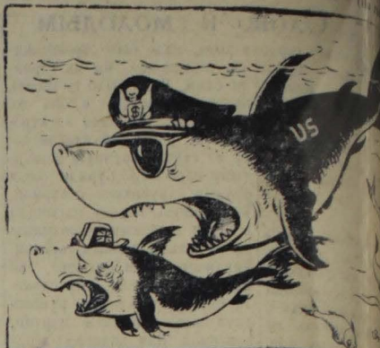
Американо-английские «переговоры» о главном командовании. Рис. Бор. Ефимова.

Все более усиливаются между западными Атлантическими, американскими и английскими ми. В частности, это находит отражение в обстановке борьбы в Англии за главные командующими военно-морскими силами в Средиземном море.