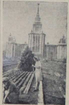
Перед высотным зданием Московского государственного университета имени М. В. Ломоносова создается большой сквер. На снимке: бригада садовников высаживает цветы и корневые растения.