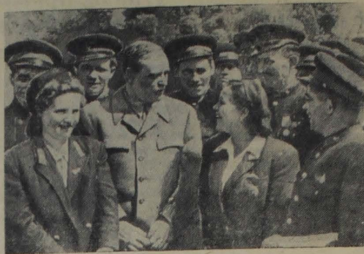
Румыния. В городе Петрошани состоялось первое всерумнское совещание передовиков угольной промышленности. Представители различных угольных районов и шахт в своих выступлениях поделились опытом работы, рассказали о своих планах на будущее, указали на недостатки, мешающие развитию угольной промышленности. На совещании с большой речью выступил председатель Совета Министров Г. Георгиу-Деж.