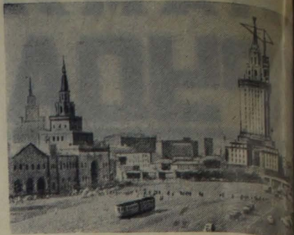
Москва. Строительство высотного здания гостиницы на моховой площади.

В первые дни учебы отличную оценку получила ученица 4 класса Тоня Рогова, хорошую—Рена Самсонова.