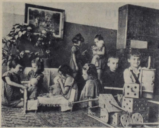
На снимке: В детском саду № 1 треста «Ленинградгазстрой».

В настоящее время в мастерских оборудована лаборатория, в которой ведется испытание форсунок перед установкой их на ремонтируемые двигатели. Это позволило значительно сократить сроки выполнения заказов.