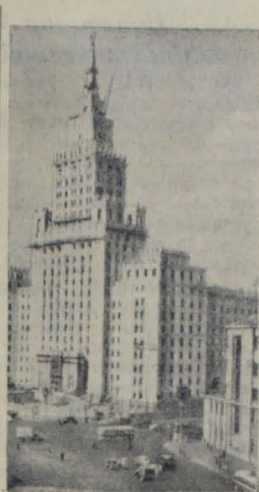
Москва. Строительством высотного здания министерства путей сообщения у Красных ворот.

Участники рейда: Л. Матвеева, Е. Тюрюс и др.