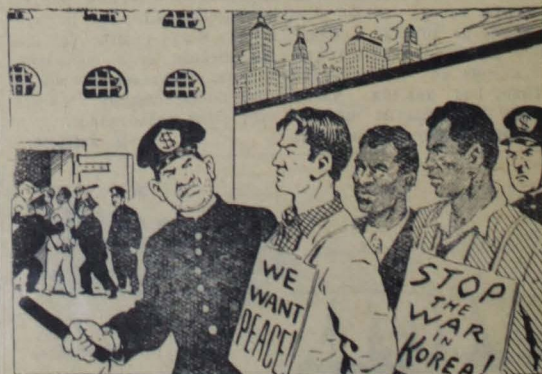
— У нас здесь полное равноправие и белые, и черные пользуются одним входом... Рис. С. Чистякова.

Как правило, негры в США не имеют права входить в общественные здания вместе с белыми.