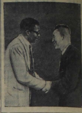
На Конференции мира в Женеве...

Праздник закончился концертной программой «Слава Советскому Союзу».