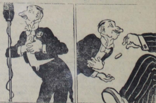
Рис. Е. Щеглова.

Лидеры правых социал-демократов, в дополнение к своей старой роли прислужников национальной буржуазии, превратились в агентуру иностранного американского империализма и выполняют его самые грязные поручения в деле подготовки войны и в борьбе против своих народов.