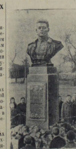
Челябинская область. В селе Ковля Еткульского района состоялось открытие бронзового бюста Дважды Героя Советского Союза гвардии майора С. В. Хохрякова.

Салюты были произведены во всех столицах союзных республик.