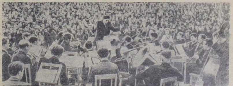
Львовская область. Большой популярностью пользуется колхозный симфонический оркестр Бобинского района. За три года существования он стал квалифицированным музыкальным коллективом. Оркестр исполняет произведения классиков русской и западноевропейской музыки и современных советских композиторов.