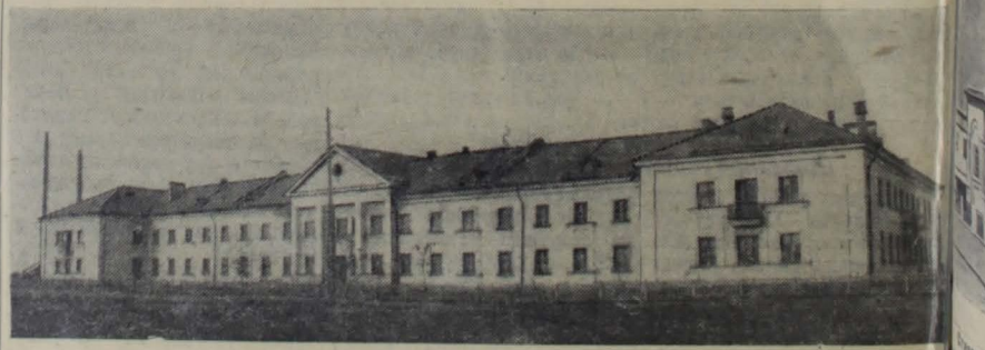
Город Сланцы. Кузница шахтерских кадров — горнопромышленная школа № 1.