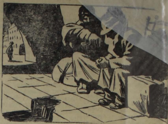
— По плану Маршалла меня лишали работы. По плану Плевана и Шумава мне остается только протянуть ноги. Рис. Е. Щеглова.