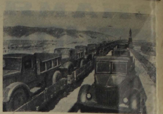
Куйбышевгидрострой. На станции Жигули, в район строительства Куйбышевской ГЭС, прибыл эшелон самосвалов с Минского автозавода. Новые машины будут работать на различных участках великой сталинской стройки.

Сессия по обсужденному вопросу приняла развернутое решение, направленное на устранение выявленных недостатков и наметила конкретные мероприятия по коренному улучшению стойлового содержания скота в колхозах района.