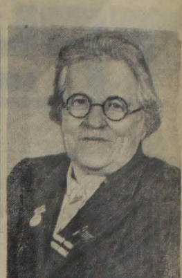
Действительный член Академии медицинских наук, доктор биологических наук, депутат Верховного Совета РСФСР, лауреат Сталинской премии Ольга Борисовна ЛЕПЕШИНСКАЯ.