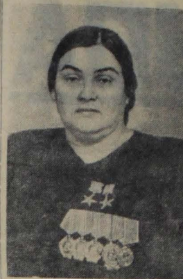
Дважды Герой Социалистического Труда, член Совета по делам колхозов при Совете Министров СССР, депутат Верховного Совета СССР Баста БАГИРОВА.