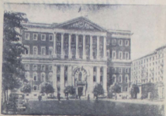
Москва. Здание Московского Совета на Советской площади.