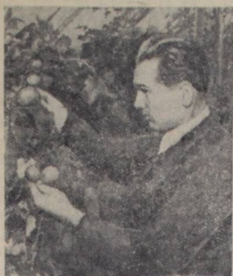
Харьков. Научные сотрудники Украинского научно-исследовательского института овощеводства испытывают существующие сорта помидоров и ведут опыты по созданию нового тепличного сорта, обладающего преимуществами перед выращиваемыми сортами.